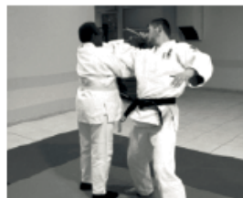
Cours adultes de Judo Ouverts à tous (même aux débutants)