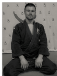
Professeur diplômé d'Etat